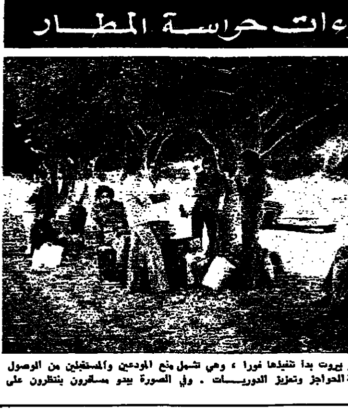
الاجراءات الجديدة لحماية مطار بيروت بدأ تنفيذها نورا ، وهي تشمل منع الوردع والمستقبلين من الوصول الى المطار ، بالإضافة الى اقامة الدراج وتزوير الدوريات . وفي الصورة يبدو مسافرون ينتظرون على طريق المطار ينتظر الرحيل

اتفاق على جبهة زغرنا - مرياطة الاحزاب التقدمية بطرابلس: سنقمع اعمال الخطف والنسف والسراقات طرابلس - من مكتب هي : محور الشبية - زغرنا ، ومحور اعادة المخطوفين المحتجزين ، كان التحرك في طرابلس والشمال امس واول امس على ثلاثة محاور والشمال .